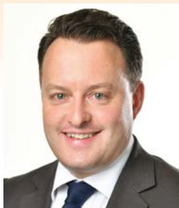
Dr. Sebastian Frehner, ancien conseiller national, Riehen (BS)